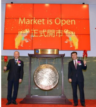
Air China Limited主催のMOC (2014年12月11日)